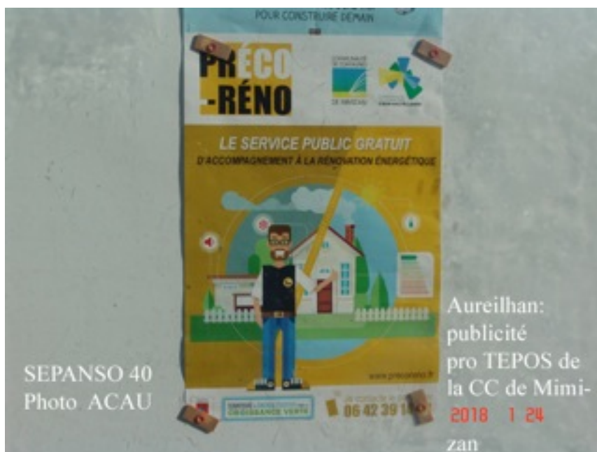
SEPANSO 40