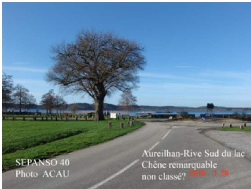
SEPANSO 40