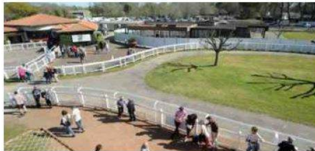
Le nouveau complexe commence à prendre forme. PHOTON, LE LIÈVRE

AMÉNAGEMENT Les travaux du nouveau complexe sur l'hippodrome des Grands Pins, dédié au public, aux professionnels et aux parieurs (restaurants, salons, bornes de jeu), et qui doit mêler tradition et modernité, ont débuté ces derniers jours. Cette construction, dont le coût est estimé à 1,3 million d'euros, devrait être inaugurée en novembre.