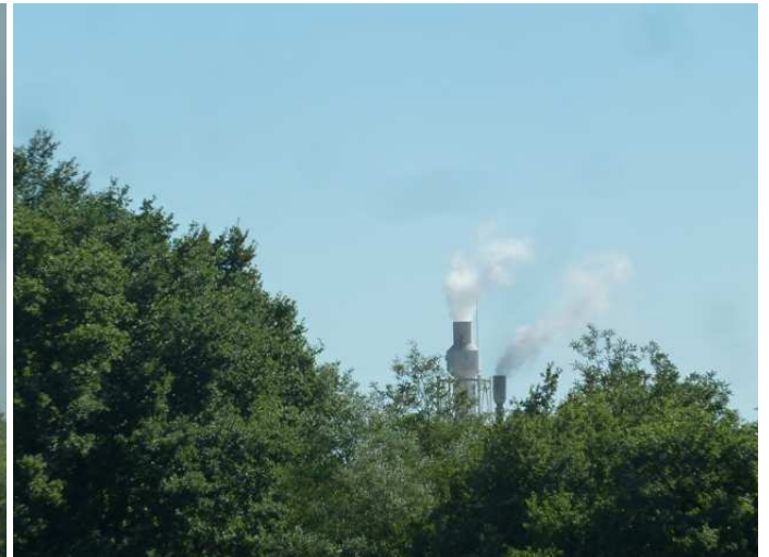
Panache « normal »