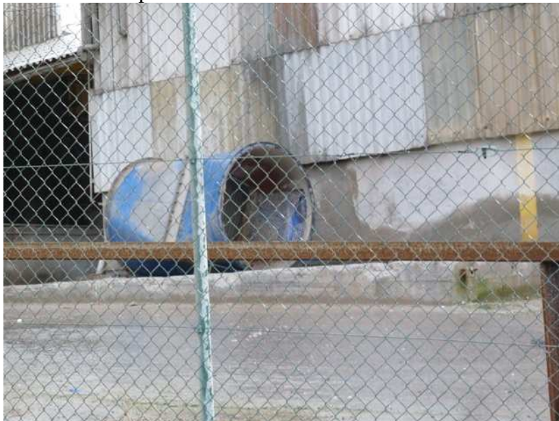
Protection anti-bruit en partie déposée