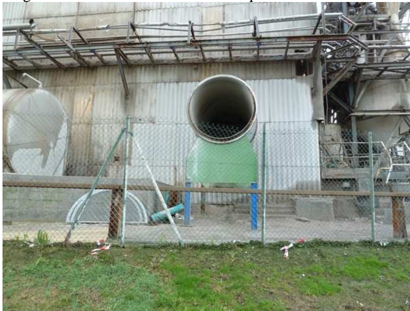
Partie active déposée

Piège à son sur entrée d'air vidé de sa partie active