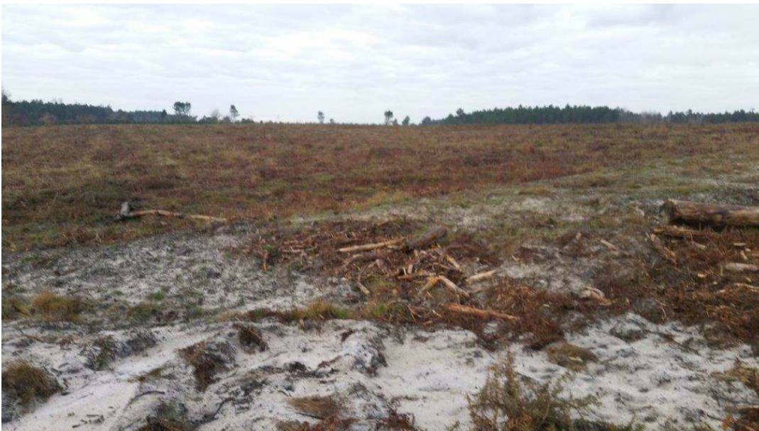
La parcelle A 89 girobroyée