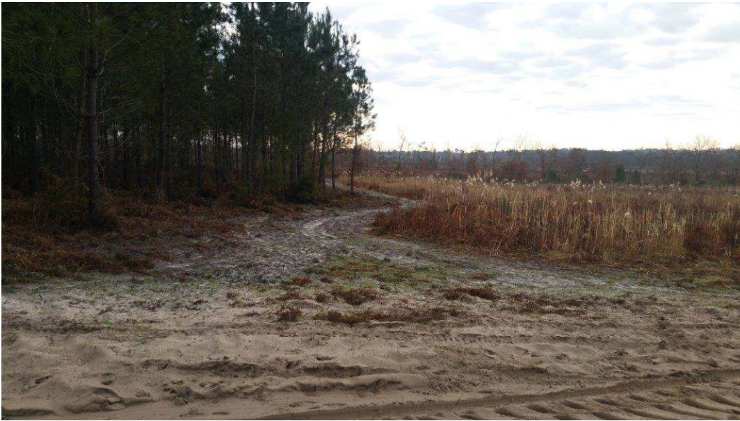
Les pins et les miscanthus sont sur la parcelle A89