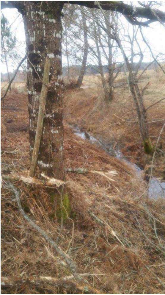
Zone humide avec ruisseau : parcelle E89