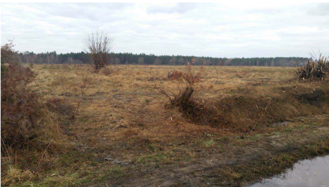
Que reste-t-il de la biodiversité sur cette parcelle après quatre girobroyages ?