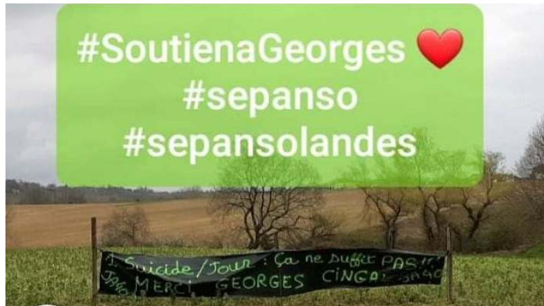
Photo d'une des banderoles avec une mer de glyphosate jusqu'à l'horizon et quelques maisons perdues au milieu de cette pollution.

Nous avons particulièrement apprécié : « Pour ceux qui n'ont lu que les titres. La SEPANSO demande une agriculture moins gourmande en eau. Pas l'arrêt de l'agriculture ! Les agriculteurs se suicident à cause des charges et des grandes surfaces qui les oppressent, des accords internationaux, etc... le manque d'eau chaque année est une évidence, il faut commencer à réfléchir pour la suite au lieu d'agresse un monsieur de plus de 70 ans à son domicile qui se bat depuis 50 ans pour qu'il nous reste 3 arbres et 3 poissons... »