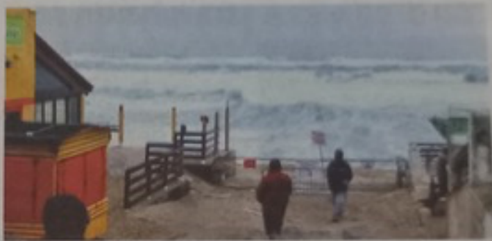
Les élus ont retiré Vieux-Boucau de la liste nationale des communes concernées par le recul du trait de côte.